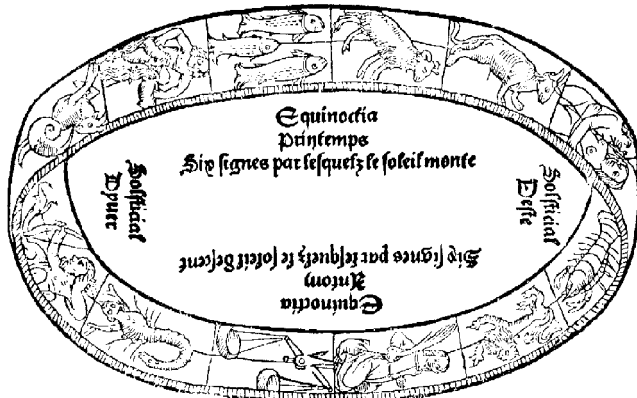
Le Zodiaque et les débuts des saisons 19

L'information donnée à propos des [éclipses] par celui qui [les] calcule ne relève ni de la science de l'invisible ( 'ilm al-ghayb ), ni de ce dont il [peut éventuellement aussi] informer en matière d'astrologie judiciaire ( ahkâm ) 17 , en laquelle il ment plus qu'il ne dit la vérité. Cela 18 , c'est en effet parler sans savoir consistant, et c'est bâti sur autre chose qu'un fondement valide.